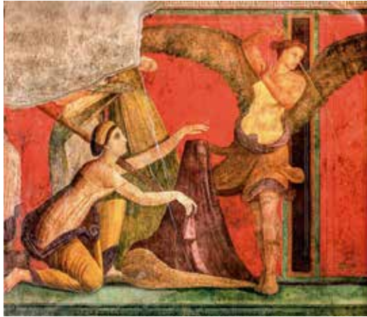
Figura 3. Mystica Vannus .

O artista da Campânia, que os arqueólogos chamam o segundo estilo pompeiano, que, nos anos 60 antes de nossa era, pintou essa Mystica Vannus na parede da vila de Pompeia, enterrada um século mais tarde sob as cinzas da erupção de 79 Antes da Era Comum (AEC), apresenta-nos um cesto de peneirar que serve de berço de vime para o membro sagrado.