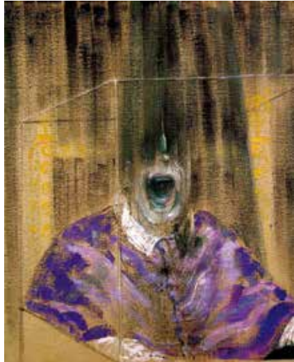
Figura 1. Cabeça VI , Francis Bacon.